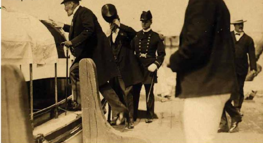
С. Витте садится в паровой катер, чтобы встретиться с президентом Т. Рузвельтом. Нью-Йорк. 1905 г.

сти. В Петербурге совершенно свободно заседал Совет рабочих депутатов, имевший свою милицию, которой боялись городовые. Бастовали все, кто только мог. Николай II раздумывал над предложением кайзера Вильгельма бежать в Германию на немецком корабле.