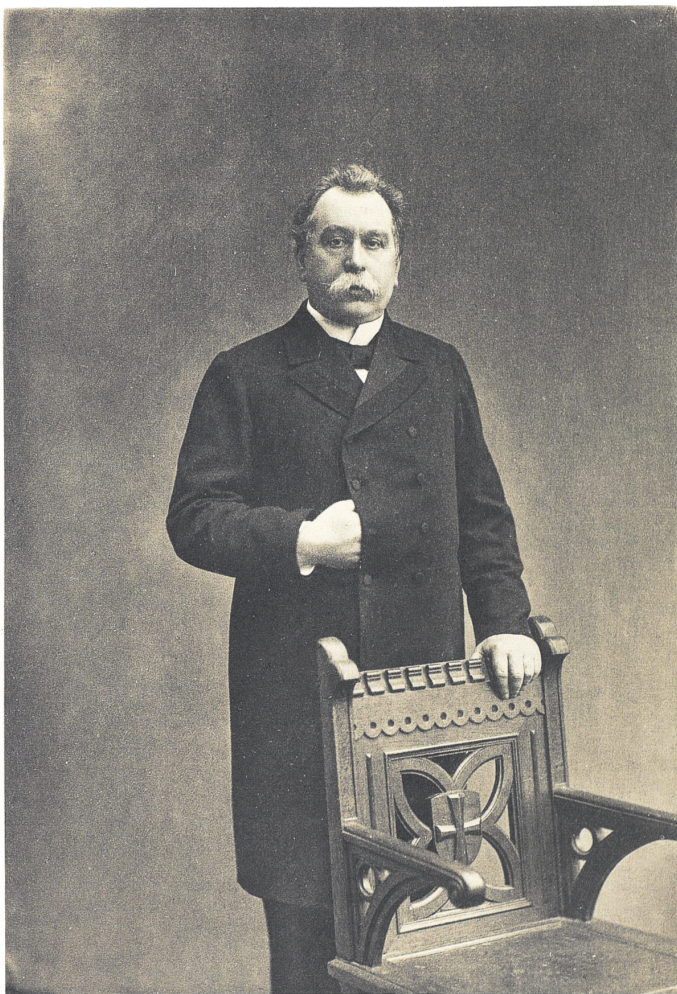
Министръ Внутреннихъ Дѣлъ, Статсъ-Секретарь, Дѣйствительный Тайный Совѣтникъ Вячеславъ Константиновичъ Плеве 1902 г.