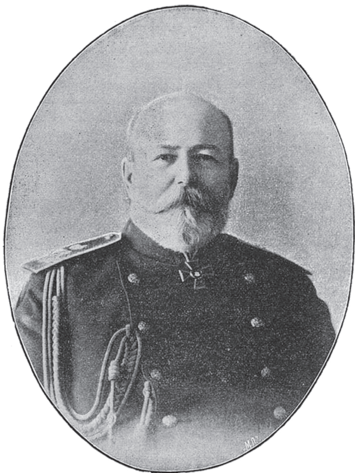
Генералъ-адъютантъ Князь Г. С. Голицынъ.