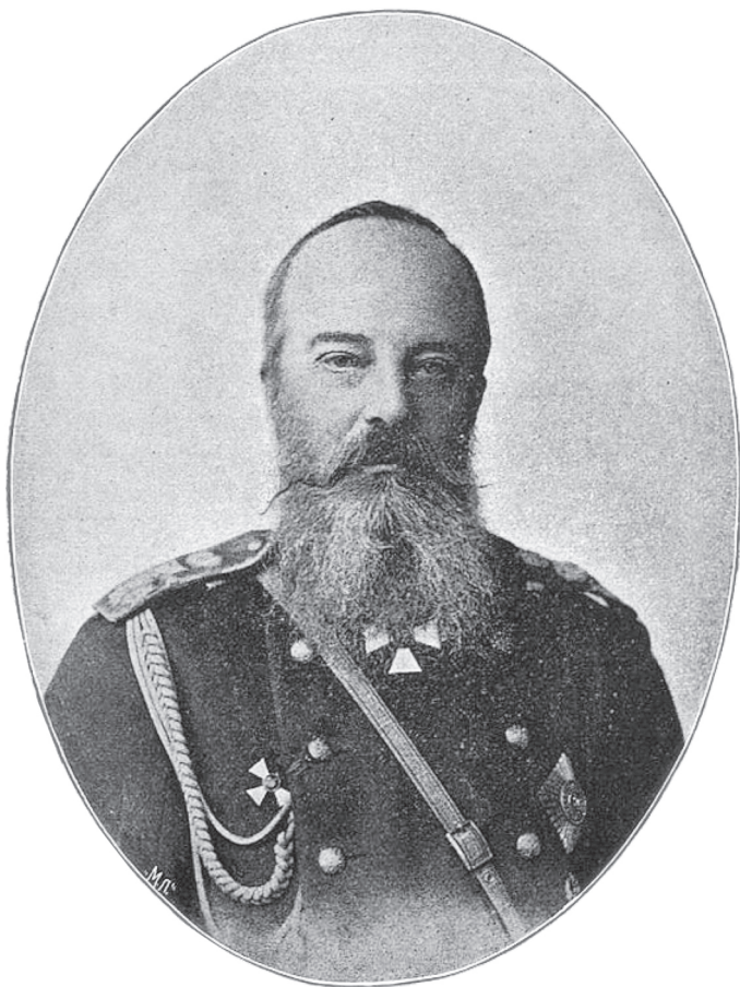
Его Императорское Высочество Великій Князь МИХАИЛЪ НИКОЛАЕВИЧЪ.