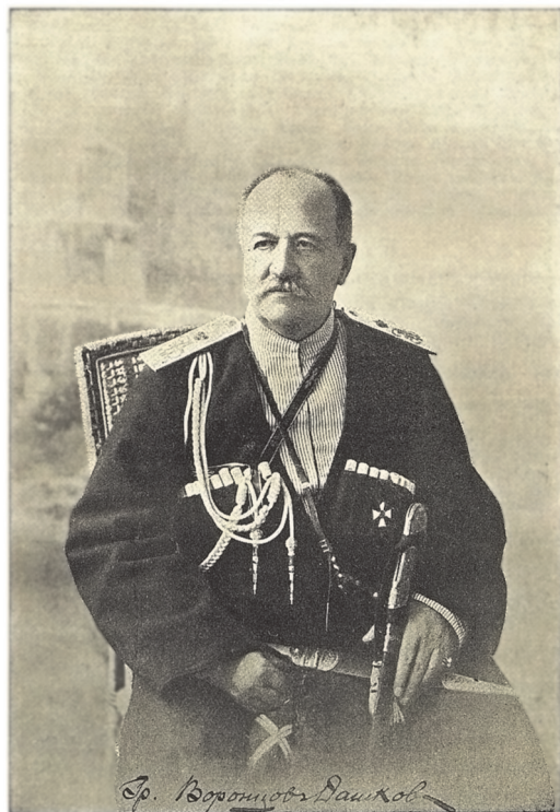
Намѣстникъ ЕГО ИМПЕРАТОРСКАГО ВЕЛИЧЕСТВА на Кавказѣ Генераль-Адъютантъ, Генераль-отъ-Кавалеріи, Графъ И л а р і о н ъ И в а н о в и ч ъ Воронцовъ-Дашковъ.