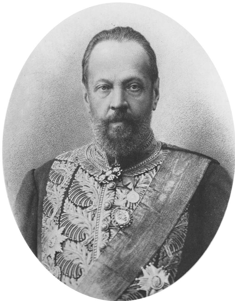
МИНИСТРЪ ФИНАНСОВ СТАТС-СЕКРЕТАРЪ