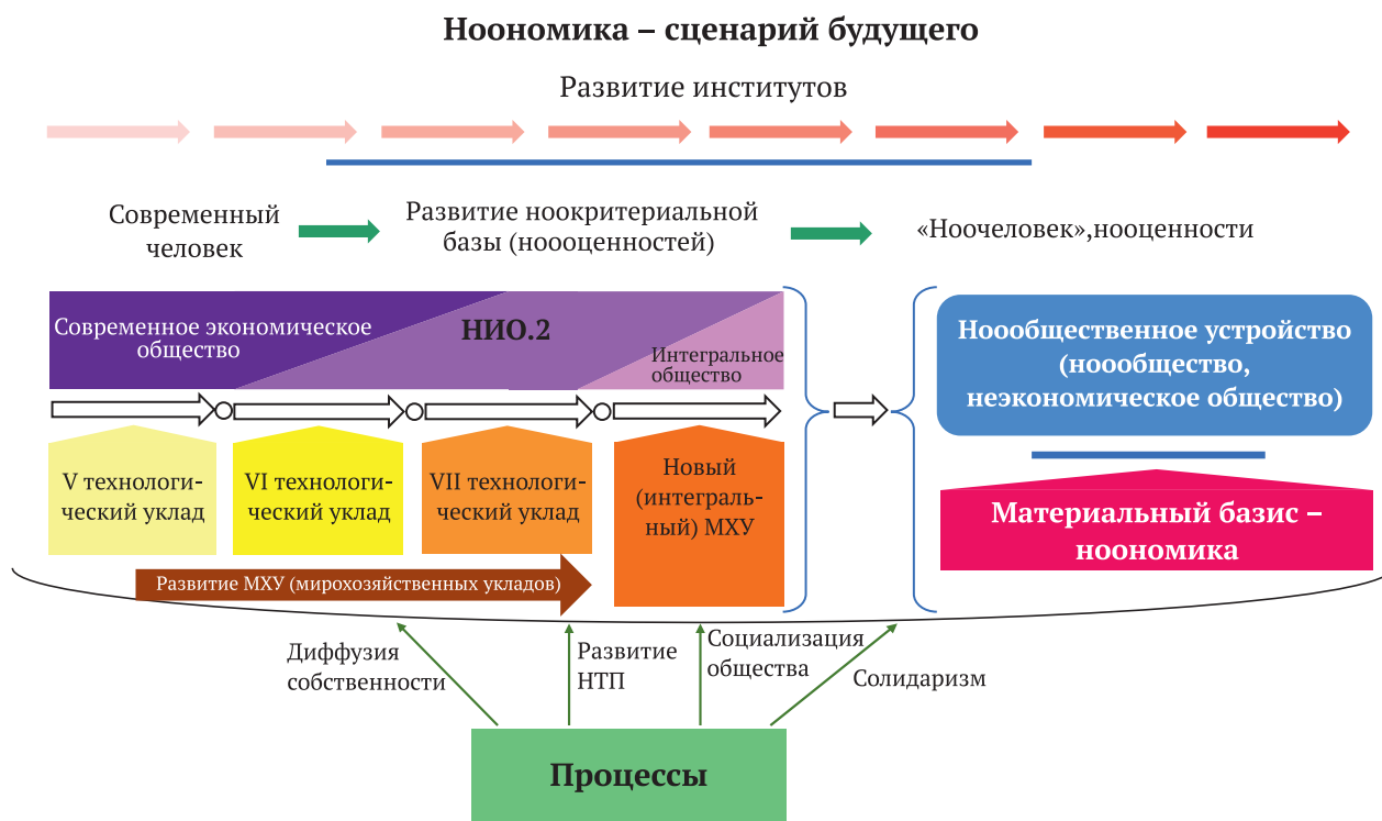
Рис. 3. Ноономика – сценарий будущего

тии); о практическом и объективно грядущем способе их удовлетворения (с выделением особенностей ноопроизводства); об абсолютно реальном общественном устройстве на материальной базе ноономики как неэкономического способа удовлетворения потребностей и формирования ноочеловека (с гармонией ноорациональности и нооценностей) – ноообщества – нооцивилизации. При этом теория ноономики (что важно!) – это не «теоретическое размышление» о некоем мифическом и сверхдалеком от нас будущем. Генезис ноономики как грядущего способа удовлетворения потребностей общества наблюдается уже сегодня , поэтому целесообразно рассматривать теорию ноономики как опору для выстраивания современной политики и хозяйственной практики государств (например, как стратегический проект (по аналогии с идеями общественного строительства в КНР), или как базовый элемент для «концептуальной платформы стратегии опережающего развития», предложенной академиком С. Ю. Глазьевым для России, или для формирования конкретных программ любых уровней (программ реиндустриализации экономики страны на технологической основе перспективного ТУ, импортозамещения, образования, обеспечения национальной безопасности и суверенитета (включая технологический) и т. п., как ориентир для бизнеса и др.). Более того, с практической точки зрения она позволяет применять в этих целях эффективные наработки из теорий стратегирования, планирования и прогнозирования, моделирования, управления и многих других.